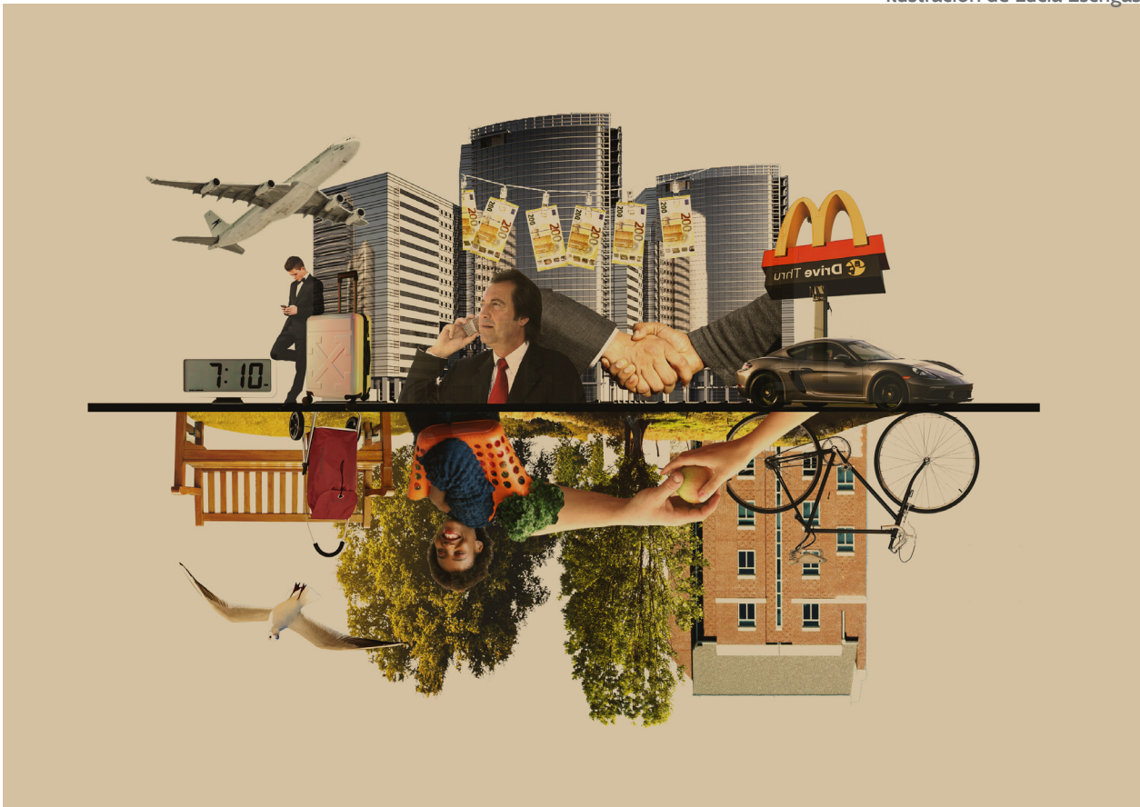
Ilustración de Lucía Escrigas