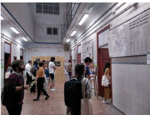
Imaxe 6: Cárcere Vello, A Coruña.