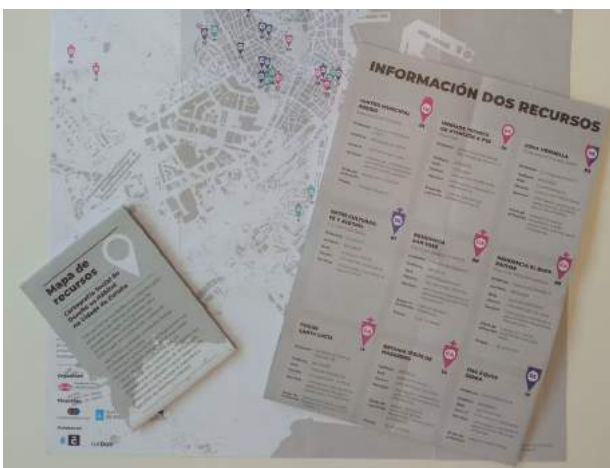
Imaxe 4: Mapa de recursos para persoas sen fogar.