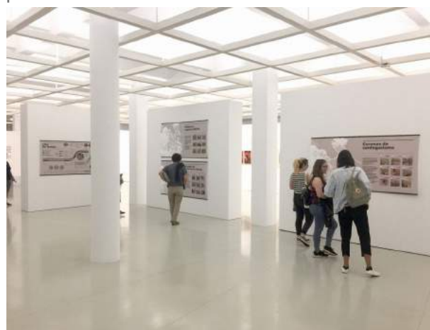
Imaxe 7: Escola Técnica Superior de Arquitectura (UDC).

Un grupo reducido de persoas voluntarias, tanto de grao como de mestrado, participou na preparación e inauguración da exposición. Como se pode apreciar nas imaxes, circulou por diferentes lugares, amosando a magnitude da exclusión residencial na cidade da Coruña, que non se pode reducir á súa cara máis visible, senón que é preciso cifrar o problema desde unha óptica ampla, para tomar conciencia e esixir políticas sociais e de vivenda acordes cun problema de amplo alcance.