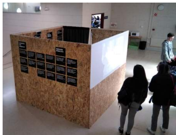
Imaxe 5: Habitáculo das voces de persoas sen fogar e profesionais.