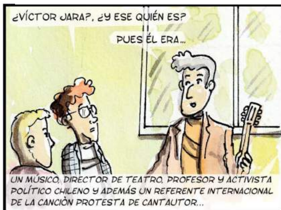
LA POBLACION - 5º EPISODIO