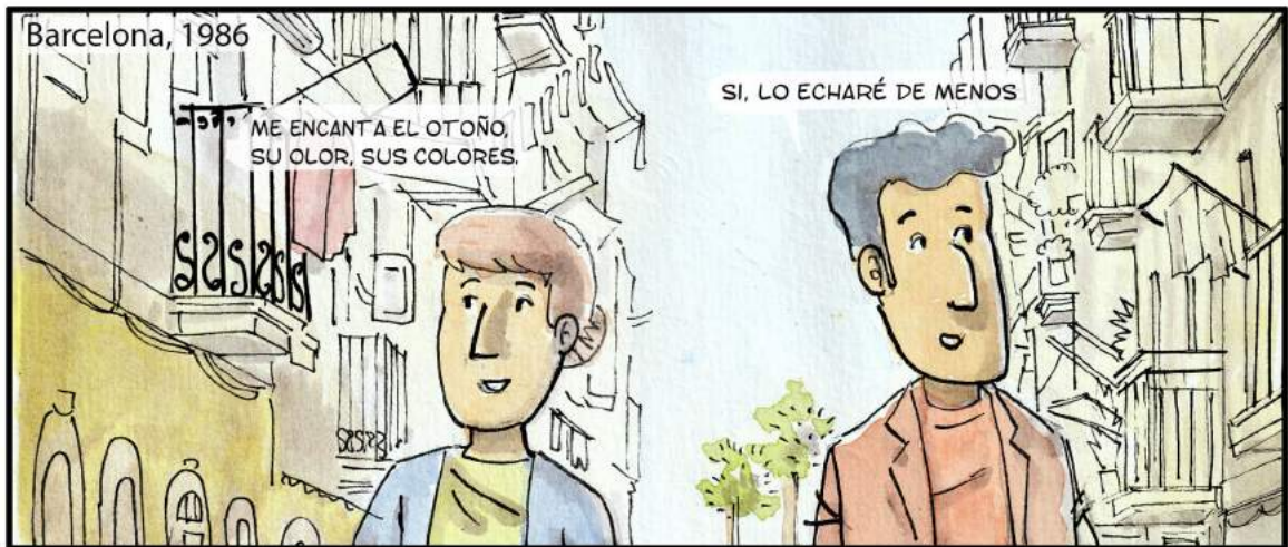
LA POBLACION - EPISODIO FINAL