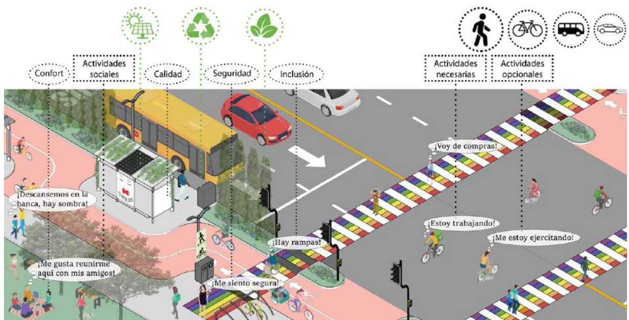
Representación de diversas actividades y personas en el día a día de un espacio público imaginario. Elaborado por la autora.

En la etapa de planificación, los procesos participativos del diagnóstico y talleres presentaron diferentes niveles y mecanismos que pertenecen a grados de tokenis-