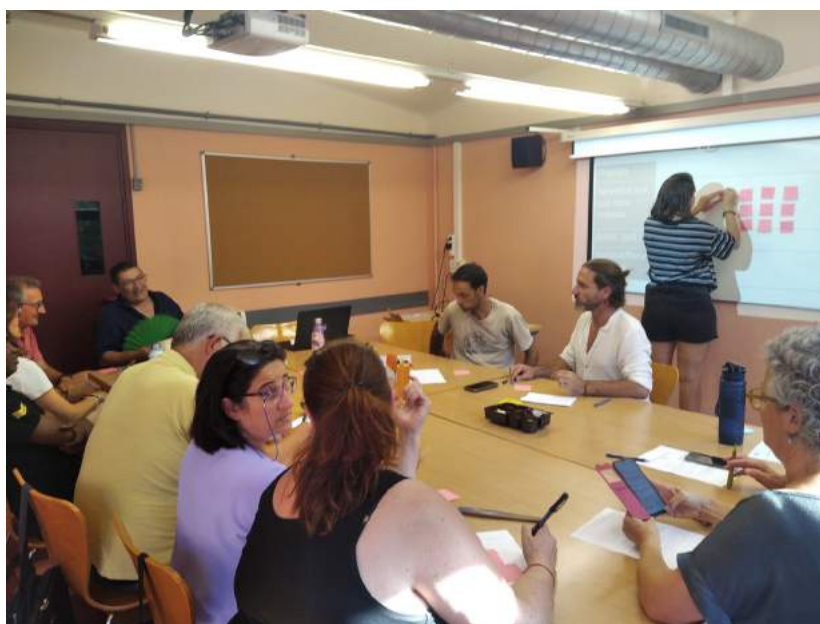
A dalt, Xarxa de comunalitats.