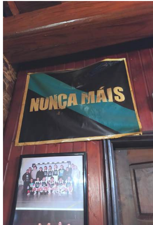
5. Bandeira do Nunca Máis colgada nun bar da Fonsagrada (Lugo).

Son centos os símbolos que artellan o imaxinario cultural da resistencia galega; ás máscaras antigás únense as caveiras, as parcas e toda imaxe da morte. Máis aló da vaca, temos os peixes que quedan en espiñas, as gaivotas escuras bañadas en chapapote. Se navegamos por este atlas iconolóxico da protesta 1 , observamos (Imaxe 4) que configura unha forma de memoria que, en face dunha nova catástrofe, permite actualizar e reactivar os símbolos. Esta memoria explica por que segue a bandeira do Nunca Máis, deseñada por Xosé María Torné, colgada das fiestras, das paredes das casas e dos muros dos bares (Imaxe 5).