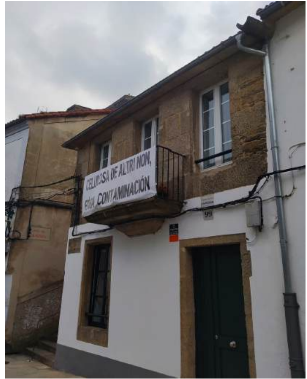
7. Pancarta nun balcón dunha casa da Rúa de San Pedro, en Santiago de Compostela.

as problemáticas actuais a través da capacidade creadora da comunidade: a baralla presenta a recompilación dun imaxinario rico, en activo, en movemento, xerado por artistas actuais moi diferentes ligados á banda deseñada, á ilustración, á gráfica, á pintura... E, ao tempo, circula e ocupa as mesas, as mans e os diálogos, permite manter a memoria do acontecido e do que está a acontecer (Imaxe 6).