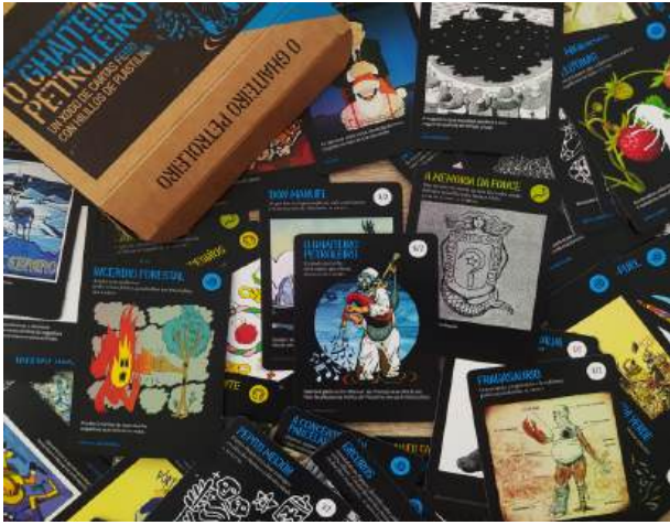
6. Baralla do xogo d'O ghaiteiro petroleiro, creado por Unha Gran Burla Negra (2023).