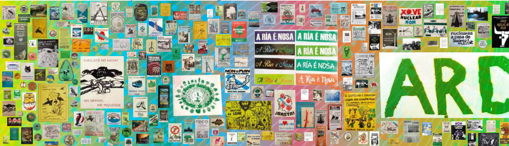
4. Pared gráfica comisariada e deseñada por Anxo Rabuñal para a exposición “Sempre máis. Arte, ecoloxía e protesta na Galiza do Prestige”, no Auditorio de Galicia entre xaneiro e maio de 2023.

Porén, non vemos ás vacas só desnutridas; portan tamén un elemento do que é preciso falar aquí: